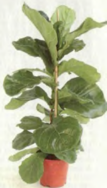
ФИКУС ЛИРОВИДНЫЙ (FICUS LIRATA)

■ Когда в горшок рядом высаживают несколько экземпляров фикуса Бенджамина, по мере роста их нередко переплетают косичкой. В местах соприкосновения стволы со временем срастутся, образуя прочную опору.