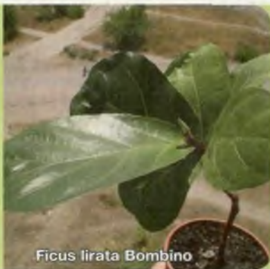
Ficus lirata Bombino

■ Фигус Лировидный идеален для оформления больших залов.